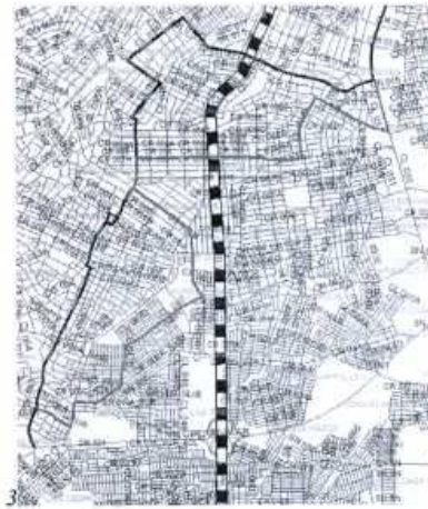
— Zoom zona de cambio de la propuesta

“POR MEDIO DE LA CUAL SE ORDENA LA REESTRUCTURACION OFICIOSA DEL SERVICIO DE TRANSPORTE PÚBLICO COLECTIVO DE LA RUTA C2 SIETE DE ABRIL-CENTO-CIRCULAR AUTORIZADA A LA COOPERATIVA DE CHOFERES DEL ATLANTICO “COOCHOFAL” PARA GARANTIZAR COBERTURA DE SERVICIO A LAS COMUNIDADES DE LOS BARRIOS LOS ROBLES . LOS ALMENDROS – CIUDADELA 20 DE JULIO – TAYRONA – SANTA ELENA – LA