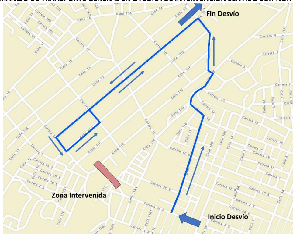
MANEJO DE TRANSPORTE GENERAL EN LA ZONA DE INTERVENCIÓN SENTIDO SUR-NORTE